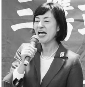
松下玲子武蔵野市長