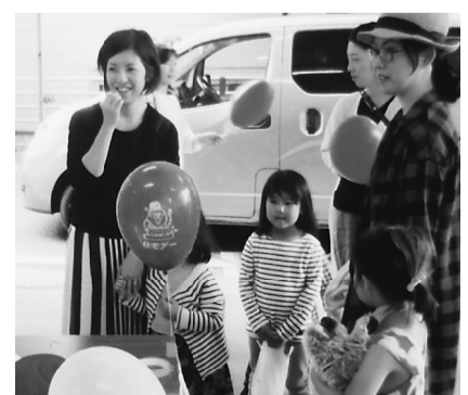
バルーンアートを楽しむ家族

バルーンアートでは動物や花などの創作に子供たちも大喜び、今年新たに企画した輪ゴムのピストルによる射的ゲームで大いに楽しんでもらいました。アンケートも多く集まり、次はいつ行おうかと聞く人もいて、地域に根差した活動になってきたと実感することができました。