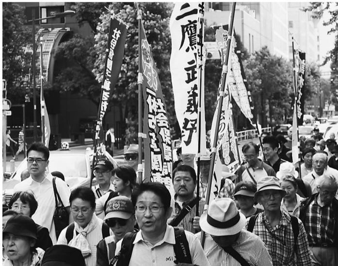
デモ行進する仲間

【社会保障対策部発】来年度の建設国保の補助金現行水準の確保、賃金・単価の大幅な引き上げ、そして建設労働者の命と暮らしを守るための予算要求集会を6月26日(水)に開催しました。 今回、交渉団以外は午前中より日比谷野外音楽堂に集合。東京都に対しての集会を行い、日比谷野外音楽堂ステージ上で都庁職員へ 【社会保障対策部発】来年度の建設国保の補助金現行水準の確保、賃金・単価の大幅な引き上げ、そして建設労働者の命と暮らしを守るための予算要求集会を6月26日(水)に開催しました。 午後には国に対しての集会を行い、全国より3611人が参加しました。(三鷹武蔵野支部からは35人) 集会後、参加者は日比谷公園から銀座を通り、東京駅まで「賃金・単価を上げる」「アスベスト被害者を救済しろ」「大衆増税反対」とシブプレビコールしながら、デモ行進しました。