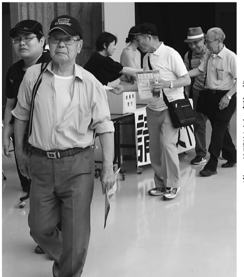
都庁職員へ要請書を提出

建設労働者・職人の賃金引き上げは、いまだに一部にとどまっています。社会保障料の原資となる法定福利費の支給は、なお不十分のままです。 働き方改革による改正労働法の施行は、建設産業に新たな課題を突き付けました。一人でも労働者を雇用する事業所では、労働時間の管理、残業代の支給や有給休暇の取得、36協定の締結などが義務付けられ、若年技能者の入職促進・定着を図ることが求められています。 建設労働者・職人の賃金引き上げは、いまだに一部にとどまっています。社会保障料の原資となる法定福利費の支給は、なお不十分のままです。 働き方改革による改正労働法の施行は、建設産業に新たな課題を突き付けました。一人でも労働者を雇用する事業所では、労働時間の管理、残業代の支給や有給休暇の取得、36協定の締結などが義務付けられ、若年技能者の入職促進・定着を図ることが求められています。