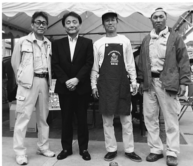
三鷹副市長（左から2人目）

3時終了後、しばらくしてから雨が降り始めました。何よりケガなく終了できて良かったです。