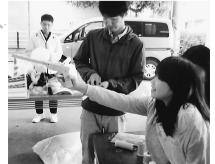
射的ゲームを楽しむ子ども

【境分会と境南町分会は、合同で境南コミセンにて住宅デーを開催しました。前年の来場者にハガキで知らせたこともあり、天気にも恵まれて、いつもより多くの人でにぎわいました。初参加の23歳と30歳の若手組合員も加わり、14人で108本の包丁を研ぎ上げることができました。