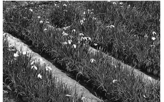
小田原城内の菖蒲

車は中央道から高尾を経て圏央道に入り、小田原厚木道へ、そして小田原城に到着。城内にて花菖蒲を見学。30分ほどにて小田原城を後にしました。 左手に波の穏やかな相模湾を見え、遠くには房総半島や大島が、近くには三浦半島。そこで初島も見ることもできました。 11時30分頃には目的地の湯河原温泉のニューウエルシティに到着。食事まで時間があつたので入浴しました。12時からの食事ではカラオケで、宴会は盛り上がりました。 14時30分ホテルを出発し、15時蒲鉾で名高い「鈴虎」で買い物をします。40分ほどでしたが、たくさんのお客様で賑わっていました。 帰路、小田原厚木道の大磯あたりで道路工事のため、渋滞があり、三鷹到着予定の17時頃が19時になってしまいました。素晴らしい天気と、何事もなく無事到着し、楽しいバス旅行となりました。