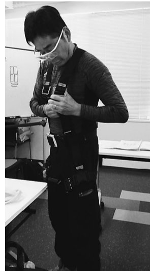
フルハーネス装着中

【職域対策部五十嵐作衛部長記】6月16日(日)、17名の参加で第2回を開催しました。第1回目は68名と沢山の参加でした。 2回目も沢山の参加を予定していましたが、今回は少なくて一時は中止になるかもとの声もありました。拡大月間中でしたので訪問行動をしながら、ようやく17名の参加となりました。 私は大丈夫という職人はいっぱいおられると思います。次回の講習会には是非、参加をお待ちしております。低層住宅もフルハーネスで命を守りましょう。