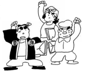
打上会を開催しました。