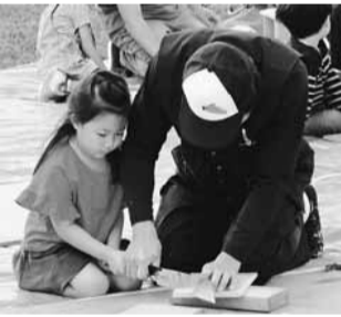
木工教室を楽しむ子どもたち

湯に充分浸かった後は、食事会・お酒が入り、打ち解けて会話も弾みました。 午後には晴れて、西湖に向かうと冠雪の富士が迎えてくれました。 テーマパーク「いやしの里根場(ねんば)」は茅ぶき民家が立ち並び、ふるさとの民芸品を展示し、販売をしていました。 紅葉は未だでしたが、天候に恵まれて、親睦を深め充実した旅になりました。