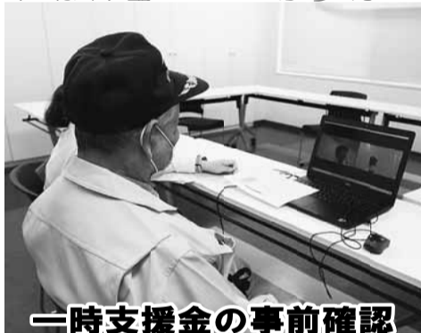
一時支援金の事前確認

1〜3月の「緊急事態宣言」の影響により50%以上売上が減少した事業者を対象とした国の一時支援金制度は、「自分も対象になるのでは…」と5月後半に多くの仲間からの相談がありました。一方で、「顧問になっている税理士や融資を受けている金融機関がない」「かなり高い手数料がかかる」と言われた「など事前確認が行えず困っている方も多く、申請をあきらめた方もいたのではないでしょうか。」 6月から申請が開始予定の月次支援金も、一時支援金と同様に初回申請時には税理士や金融機関に よる「事前確認」が必要です。組合では、事前確認の相談先がない方を対象として、税理士の紹介を行うことができます。(※ある程度の人数になったところでまとめて受付となります。申請の対象となるかどうかも含めて、まずはご相談ください。)