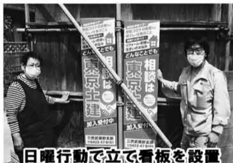
日曜行動で立て看板を設置

ただいたすすべての組合員・家族のみなさんに改めて感謝申し上げます。この春の月間では、昨年度に引き続き建設アクションと運動させた「誰ひとり取り残さない」ことをスローガンに掲げて、相談活動に重点を置きました。月間後半は緊急事態宣言下の活動を余儀なく