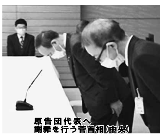
原告団代表へ謝罪を行う菅首相(中央)