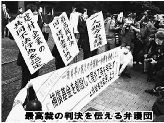
最高裁の判決を伝える弁護団