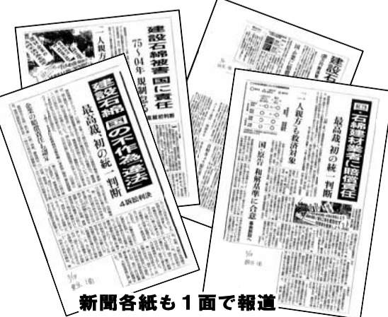
新聞各紙も1面で報道