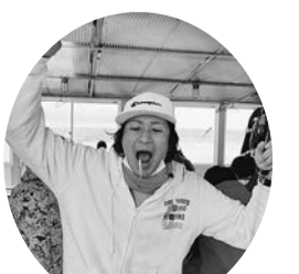
ワカサギ獲ったぞ~!

【青年部発】2月19日、多摩川を会場に、墨田支部や本支部からもゲスト参加があり全体で15名(支部からは3名)が参加しました。山中湖に着くと小雨が降り、気温は低く、船が出る時には虹がかかるなど、この日の幸運を予感させました。ドーム船の中でエサをつり針にさすのに悪戦苦闘しながらも、何とか糸をたらし、釣りがスタート。そこから3時間釣り続けた結果は、合計4匹と散々な釣果でした。釣りの成果は本当に散々でしたが、優しい漁師さんからプレゼントしてもらったワカサギを天ぷらにして無事みんなで食すことができました。その後ふじやま温泉に移動し宴会では大いに食べ飲み交流することができました。