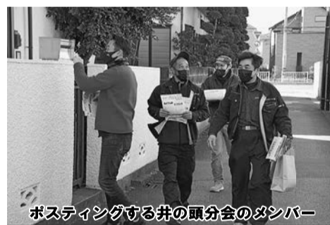
ポスティングする井の頭分会のメンバー

【労働対策部発】2月17日、労働対策部が中心となってアスベスト問題の周知行動に取り組み、全体で17名が参加しました。この取り組みは、アスベスト訴訟においていまだ建材メーカーが責任を認めていないことを追及するだけでなく、昨年4月から法改正がされたアスベストの事前調査の周知を地域住民へ知らせるために、チラシ配布を行います。また今回は、詐欺被害が広がっている「点検商法」に対する注意喚起を促すチラシと「ドローン」による屋根調査チラシも同時に配布。4班に分かれて事前に準備した住宅地図にもとづいて、スタートしました。