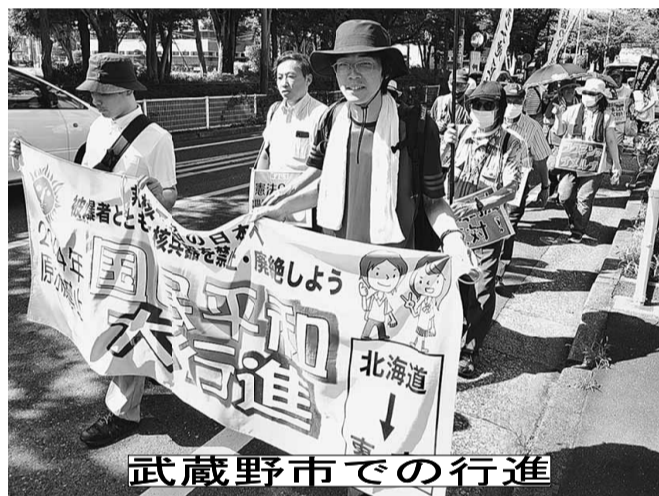
武蔵野市での行進

今年も平和行進の季節がやってきました。広島・長崎に原子力爆弾が投下され、日本が敗戦してから79年、平和を祈念する原水爆禁止世界大会に向けて思いを込めて全国で行進します。元々平和行進は1958年に東京で行われた第4回原水爆禁止世界大会に向けて、核兵器の廃止を願った僧侶を中心に歩いたことが始まりです。その後毎年欠かさず行われています。組合では武蔵野市、三鷹市の平和行進に参加しており、今年も