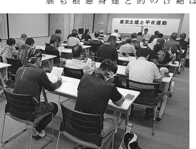
争協力体制と同様にすでに動員体制に組み込まれており、「戦争をしない」と誓う憲法9条を守ることを、「戦争をさせない」外国努力を強化することが何よりも必要です。私たちが謳歌する平和は、戦争の歴史の中で翻弄