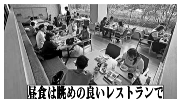
昼食は眺めの良いレストランで

【厚生文化部記】組合が提供している火災・地震共済は自家共済で、民間の火災保険に比べて安い掛け金の特徴です。多くの仲間が加入することによって制度は強力になって行き、安定運営を行う事ができます。その為、厚生文化部では毎年2回加入者増を目指す取り組みを行っています。今秋は①新加入者にターバンカレープレゼント②新加入・既加入者向けプレゼントキャンペーン③5組合キャンペーンの3つを開催しています。