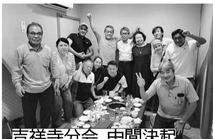
吉祥寺分会 中間決起

【吉祥寺分会】は9月28日に焼肉を行い13人が参加、初めて参加する方も親交を深め、拡大の達成を確認することができました。【牟礼北野