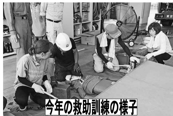
今年の救助訓練の様子

【仕事対策】 長年の救助訓練への参加が功績として認められ、東京消防庁より感謝状が送られました。これまでも三鷹消防署から感謝状を頂く事がありましたが、東京消防庁に際して、