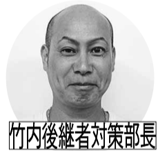
竹内後継者対策部長

当日は最初に勝沼にある一古園へ向かいシャインマスカット狩りを体験、同じ木でもぶどうの房によって味が違うなどシャインマスカットを堪能しました。その後