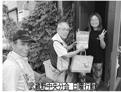
武蔵野中央分会 日曜行動