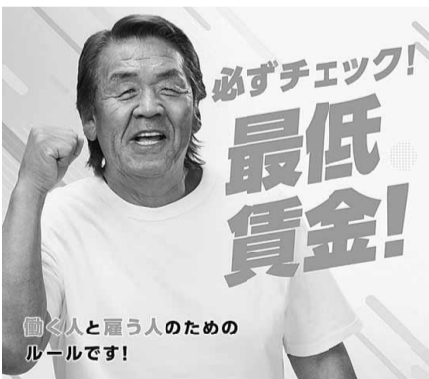
働く人と雇う人のためのルールです!