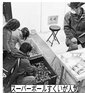
スーパーボールすくい人気

ティブな意見が寄せられました。今後も2カ月に1回程度開催を目指し、地域に根差した組合であることをアピールしていきたいと考えています。企画側、参加側どちらも構いませんので、組合の仲間の参加をお待ちしています。