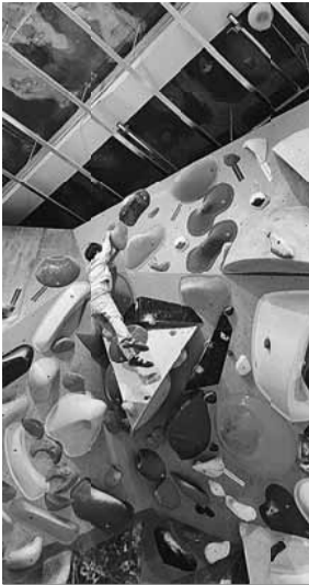
息子さんの習い事

マスターコースからアスリートコースに移り上達するわが子の成長を微笑ましく眺め、コーチから素質がありますよと言われると、親バカなのか喜んでいました。そんな時に少し父親として良い所を見せようとして