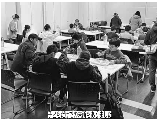
子どもだけの来所もありました

は来所もありませんでしたが、5時30分を過ぎると波のように来場者が現れました。支部の駐輪場はすぐに満杯になり、入場が出来なくなるとは思いましたが、準備しておいたスーパースポーツとコッパトイのブースで時間を潰してもらい、順番で入場して貰う状況を作ることができました。来場者には笑顔が見られ、企画参加側のモチベーションもぐんぐんと上がって行き