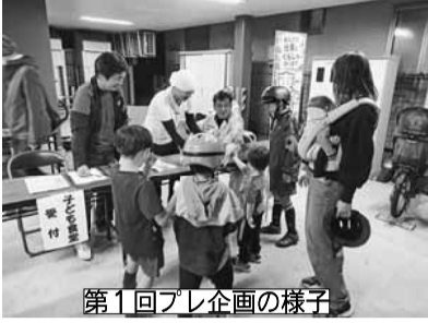
第1回プレ企画の様子