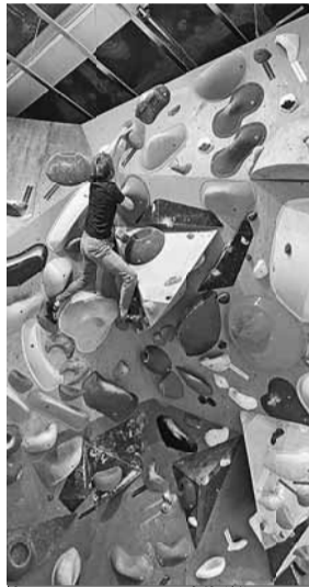
松本さんも挑戦中!

ズを買って一緒に課題に挑戦しています。登り方など、子どもからアドバイスを貰って頑張っています。壁にも挑戦したいと思っていますので、またの機会に書きたいと思います。後編に続…(後編は未定です)