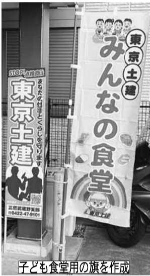
子ども食堂用の旗を作成

が急増し、配布後数日間だけ70人を超える予約が入りました。想定を超える予約があった為、支部に入りきらないくらい人が押し寄せる懸念が生まれました。次回からは時間ごとの予約枠を設ける等対策をとる予定となりましたが、今回の為に武蔵