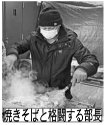
焼きそばと格闘する部長

第2回プレ子ども食堂開催しました。最初は本当にやるのかと不安しかありませんでした。食事の準備をしていて100人分の唐揚げを作るのこんなに手間がかかるのかと圧倒されました。美味しくなれ!美味しくなれ!