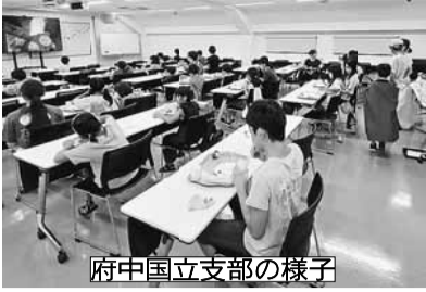
府中国立支部の様子

開催に当たって、すでに取り組んでいる他支部への視察を行いました。府中国立支部では毎月第4土曜日に子ども食堂を開催しており、視察を申し入れた所快諾をいただき、2024年の8月24日に後継者・女性の会で視察を行いました。地域の沢山の子も達が参加している事や、運営する組合員が生き生きと活動している様子が見られ、ぜひ三鷹武蔵野支部でも取り入れたいとの結論になりました。