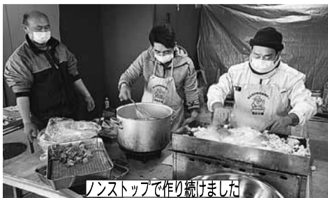
ノンストップで作り続けました