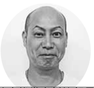
竹内後継者対策部長

とあってという間に開始時間となり、続々と子どもたちが集まってきました。慌ただしかったですが、来てくれた皆が美味しい美味しいと笑顔だったので子ども食堂をやった良かったです。