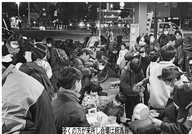
多くの方が来所し会場は超満員

だとか、「東京土建がどのような団体なのか知れてよかった、住宅デーの包丁研ぎもお願いしたい」とポジ