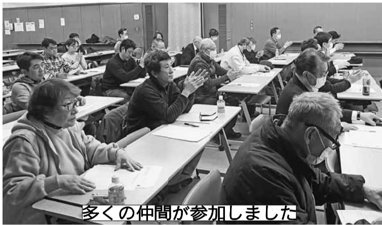
多くの仲間が参加しました

発行所 東京土建一般労働組合三鷹武蔵野支部 東京都三鷹市上連雀7-33-8 電話 0422(47)9101 Fax 0422(47)9104 発行責任者 竹内 敦